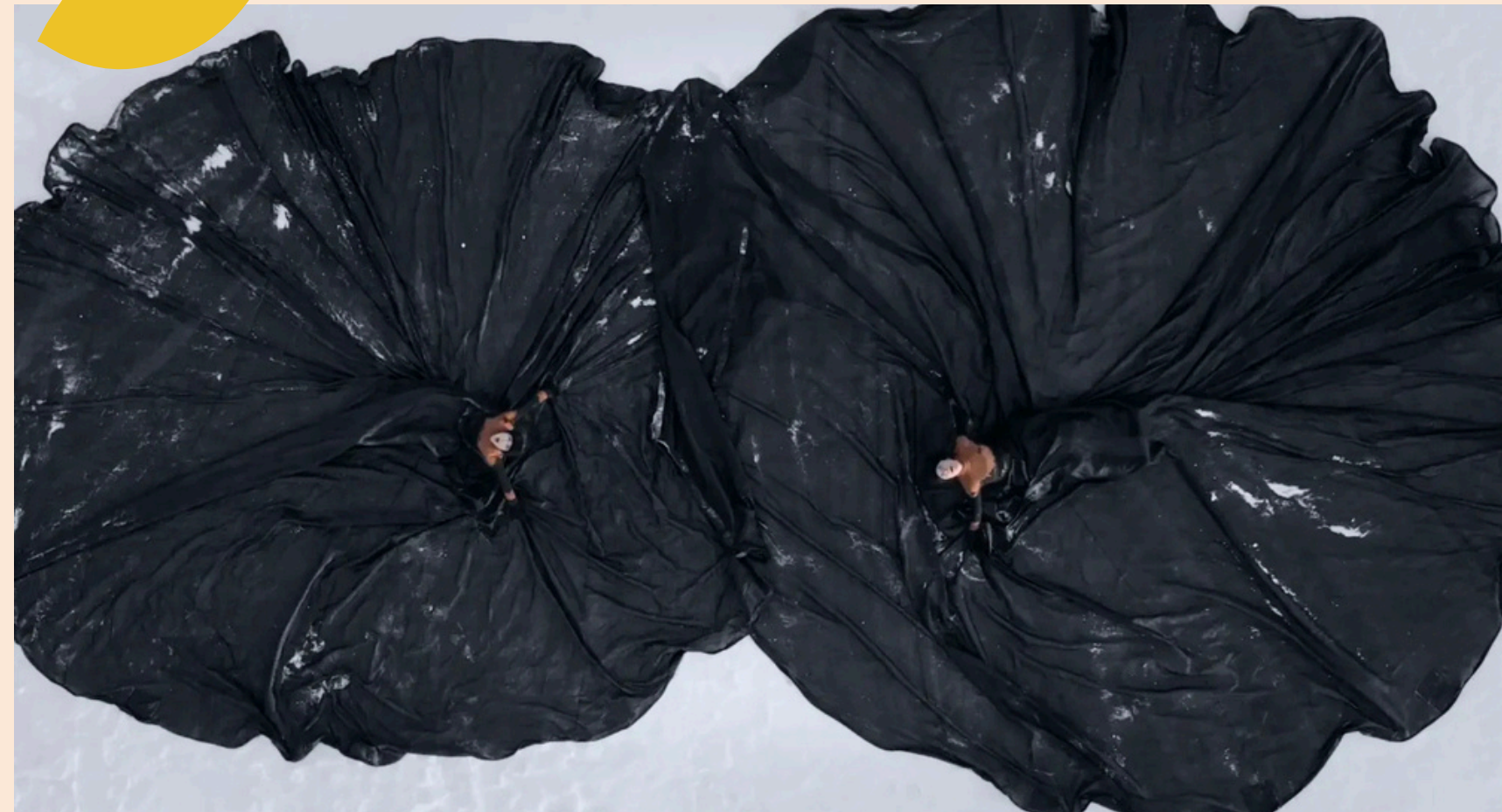
Marée Noire Fleuve Espace Danse