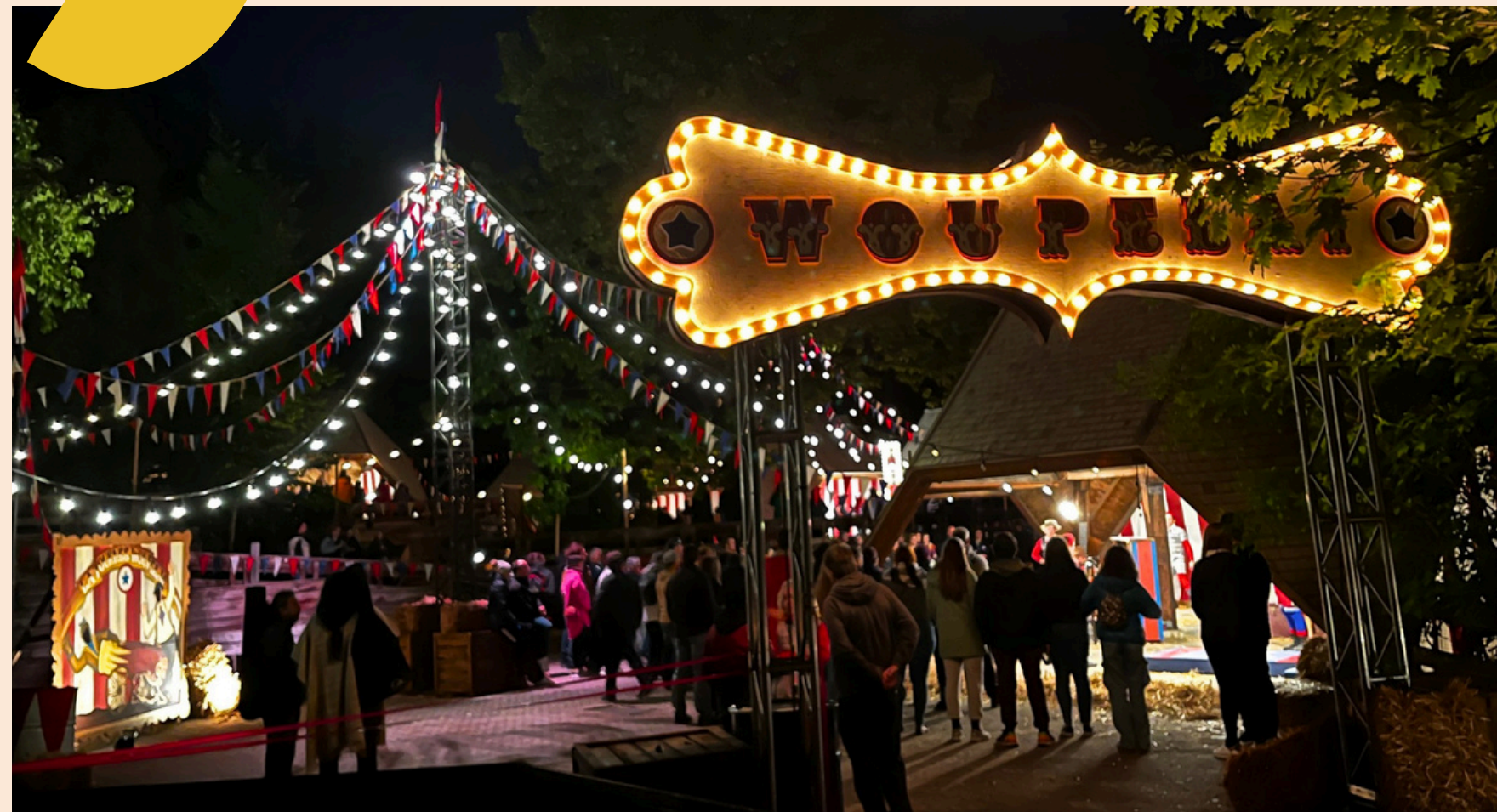
WOUPELAÏ Où tu vas quand tu dors en marchant?