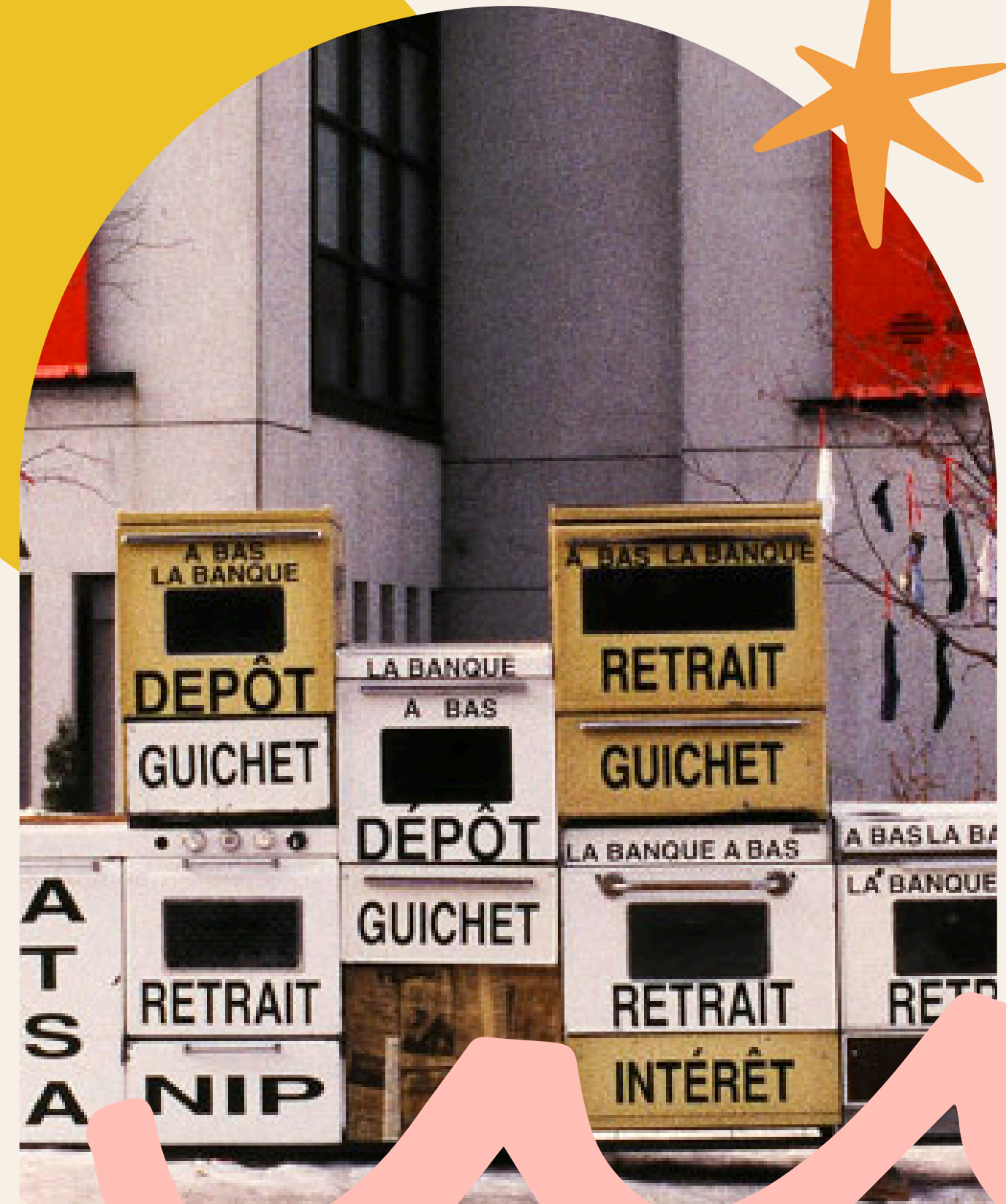
La Banque à Bas ATSA

La création devient un espace de prise de parole, de réflexion ou de positionnement, en lien direct avec les enjeux du territoire et des communautés.