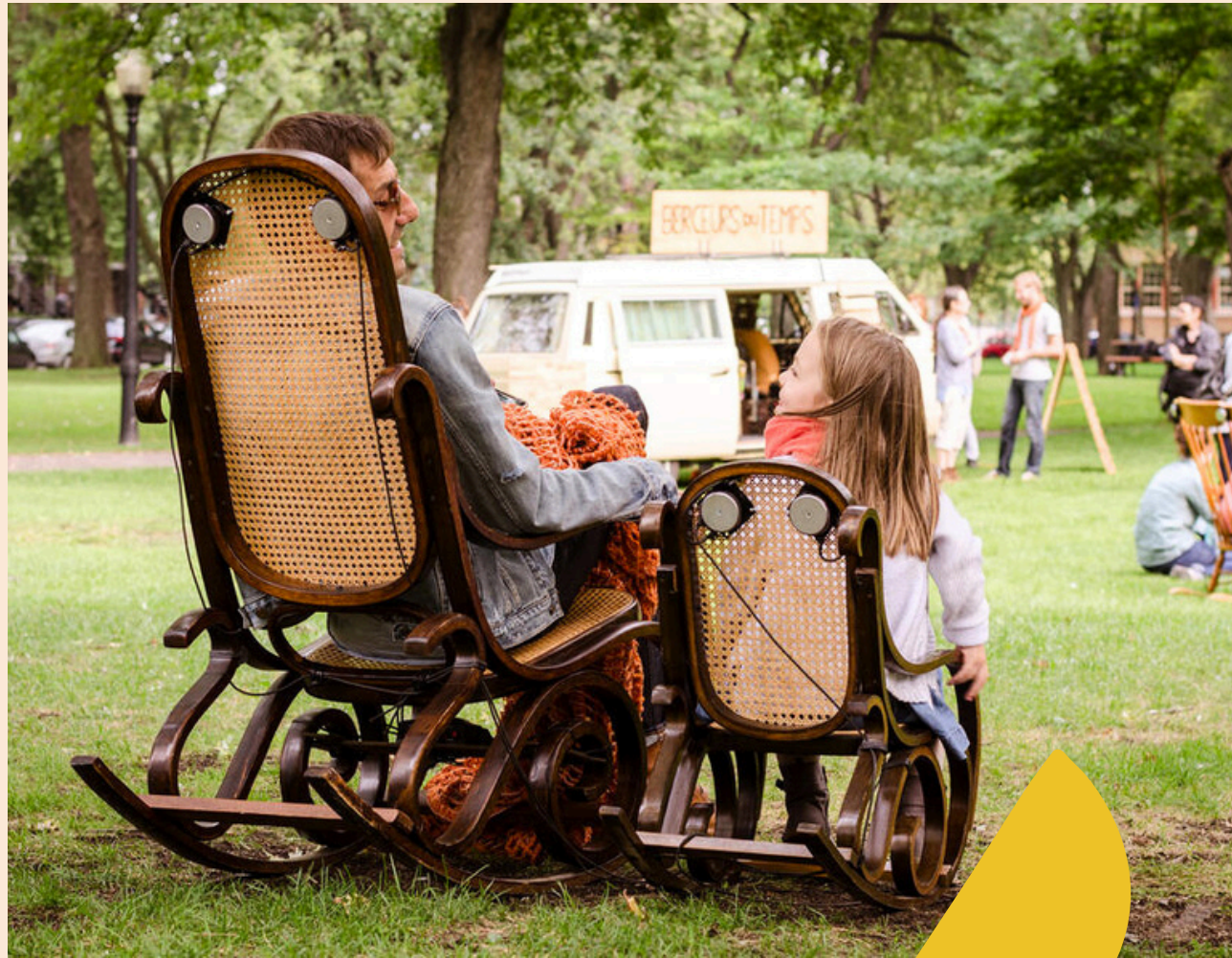
Berçer le temps Berceurs du temps