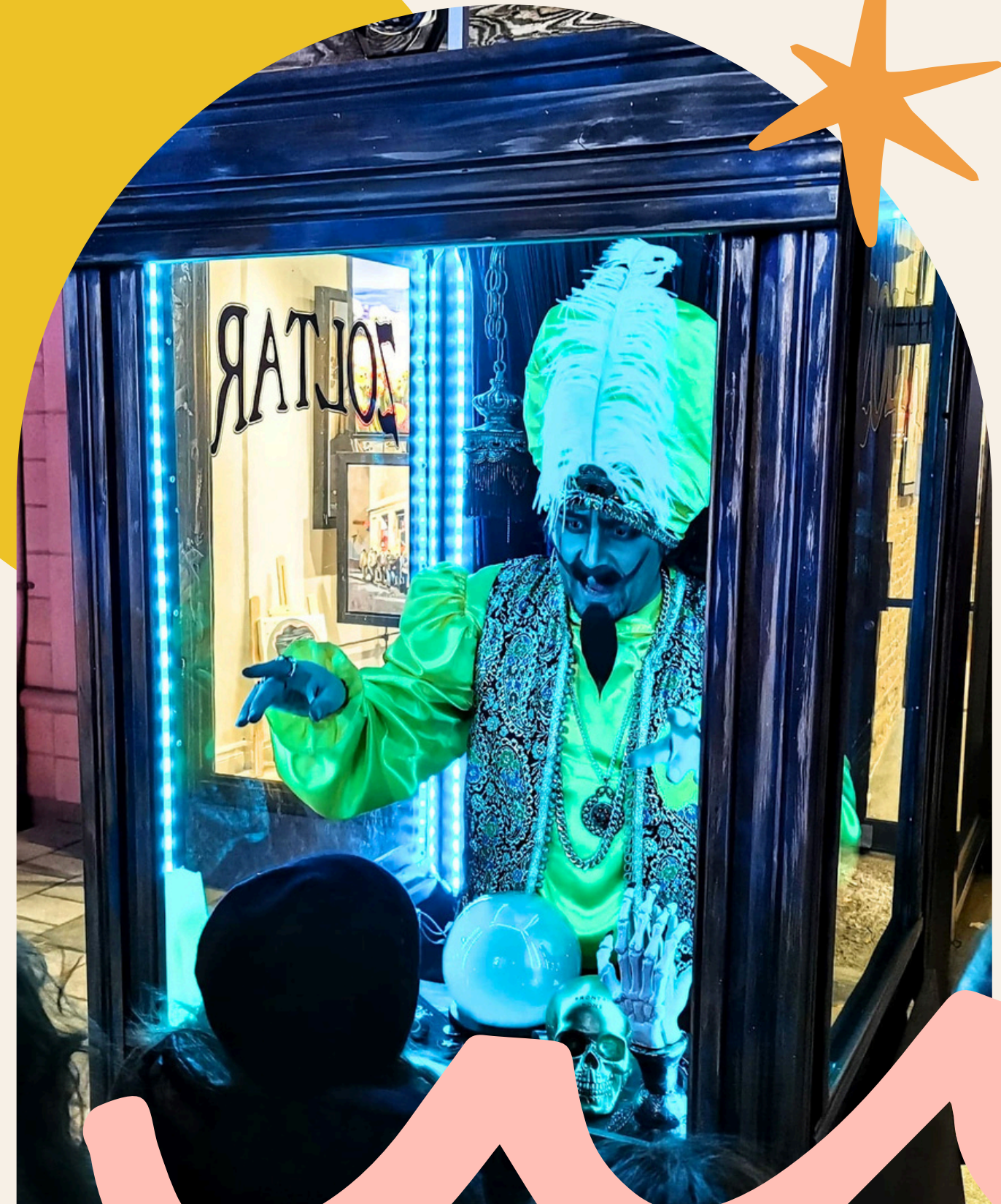
Le Grand Zoltar Bazar Production

L'œuvre prend forme à travers l'échange, la participation et la rencontre, en laissant une place importante à l'imprévu et à ce qui émerge du collectif.