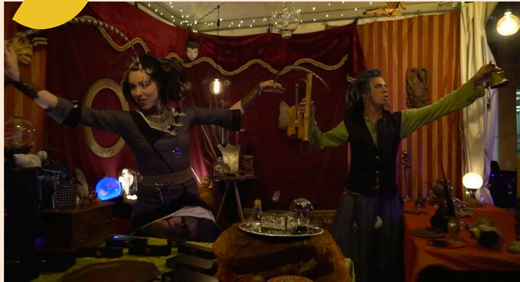
Curiosités Mystiques Kaoso