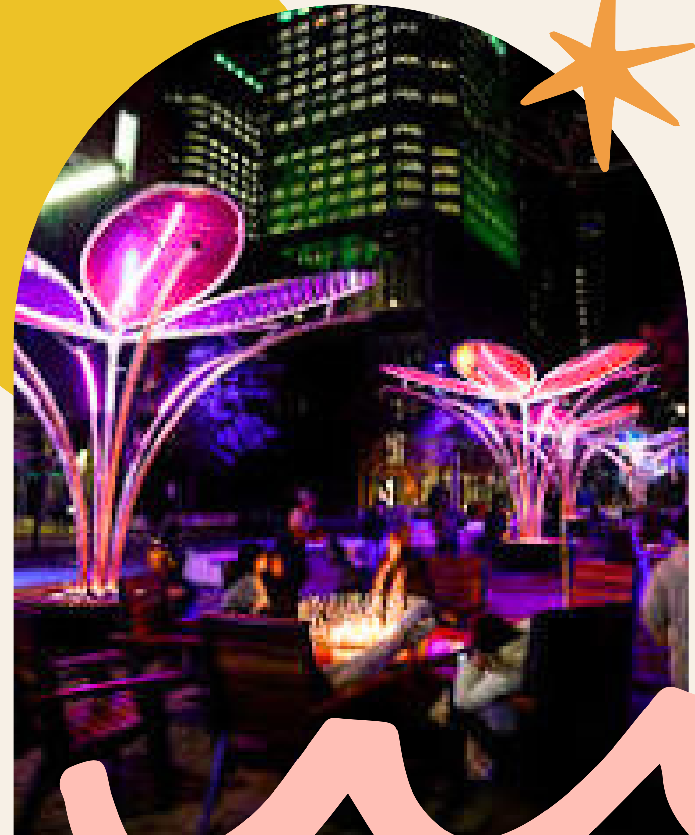
Lumino Quartier des spectacles

Le public est amené à vivre un moment enveloppant, contemplatif ou interactif, où l'attention, les perceptions et le rapport au temps et à l'espace sont transformés.