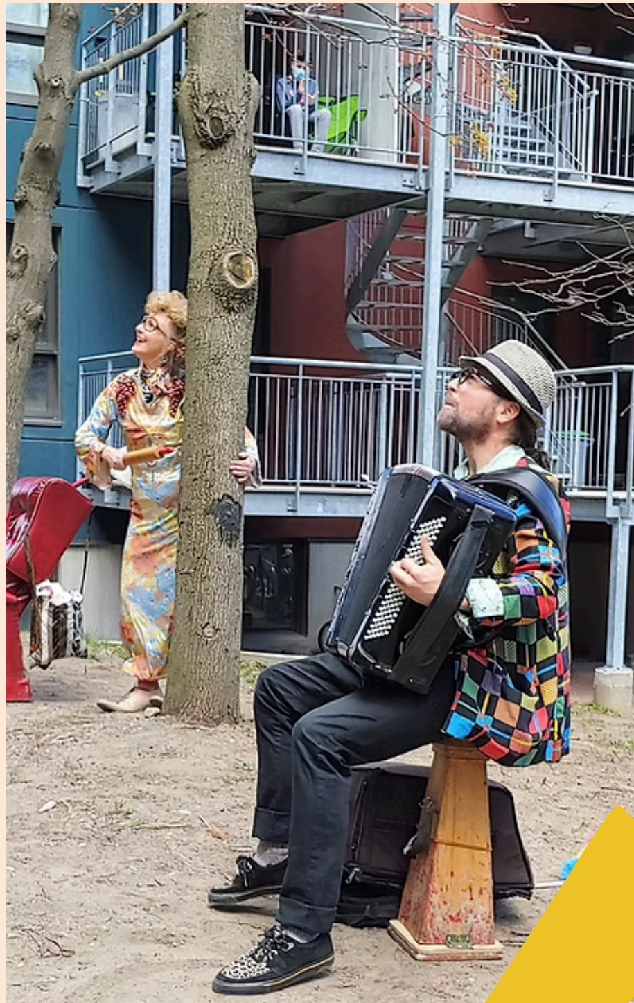
Les Balconfiné.e.s Drôldadon