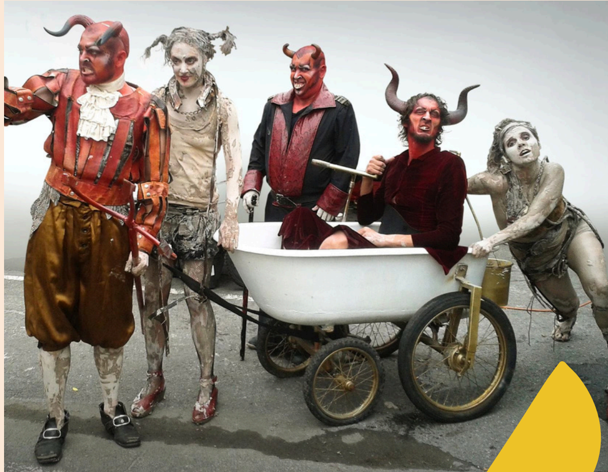
Bain de pétrole Espace Forain