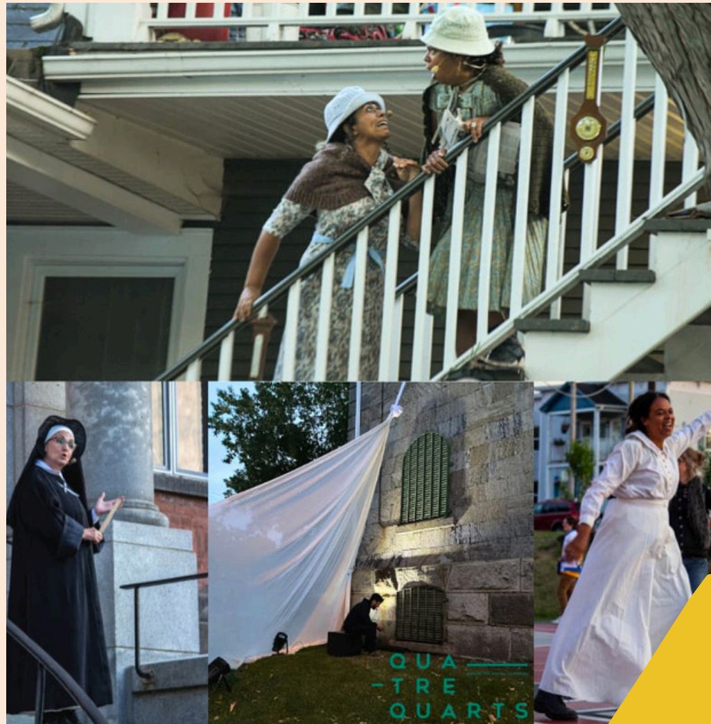
4 Quarts Théâtre des petites lanternes