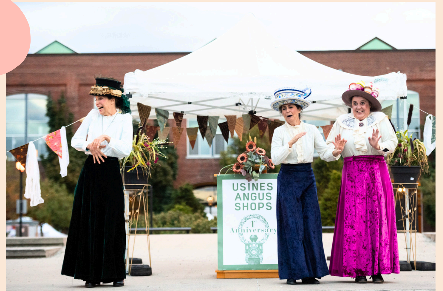
Angus! Tragi-comédie rosemontoise Toxique Trottoir