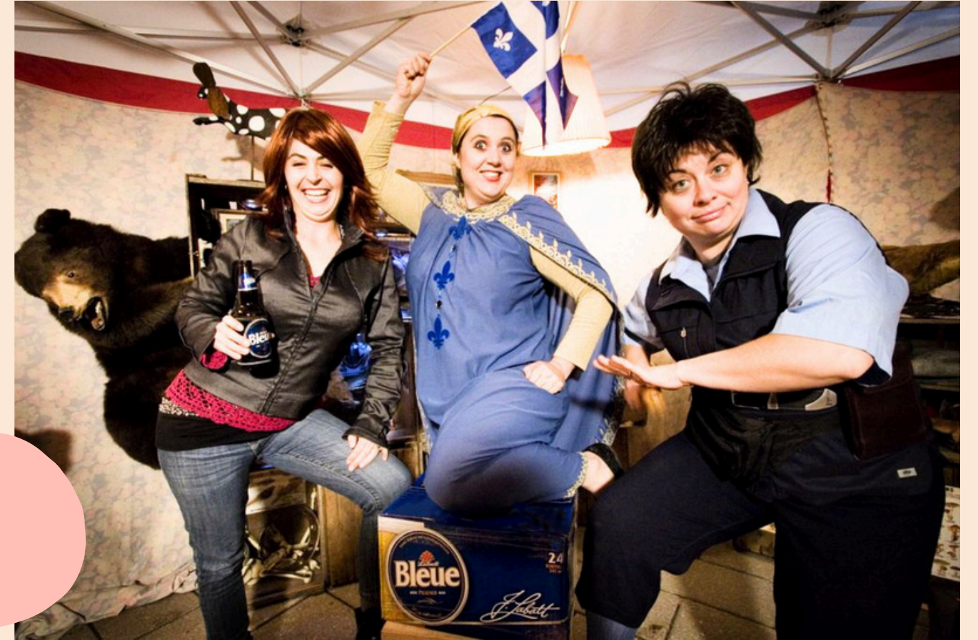
Le Musée des vieux animaux québécois Toxique Trottoir