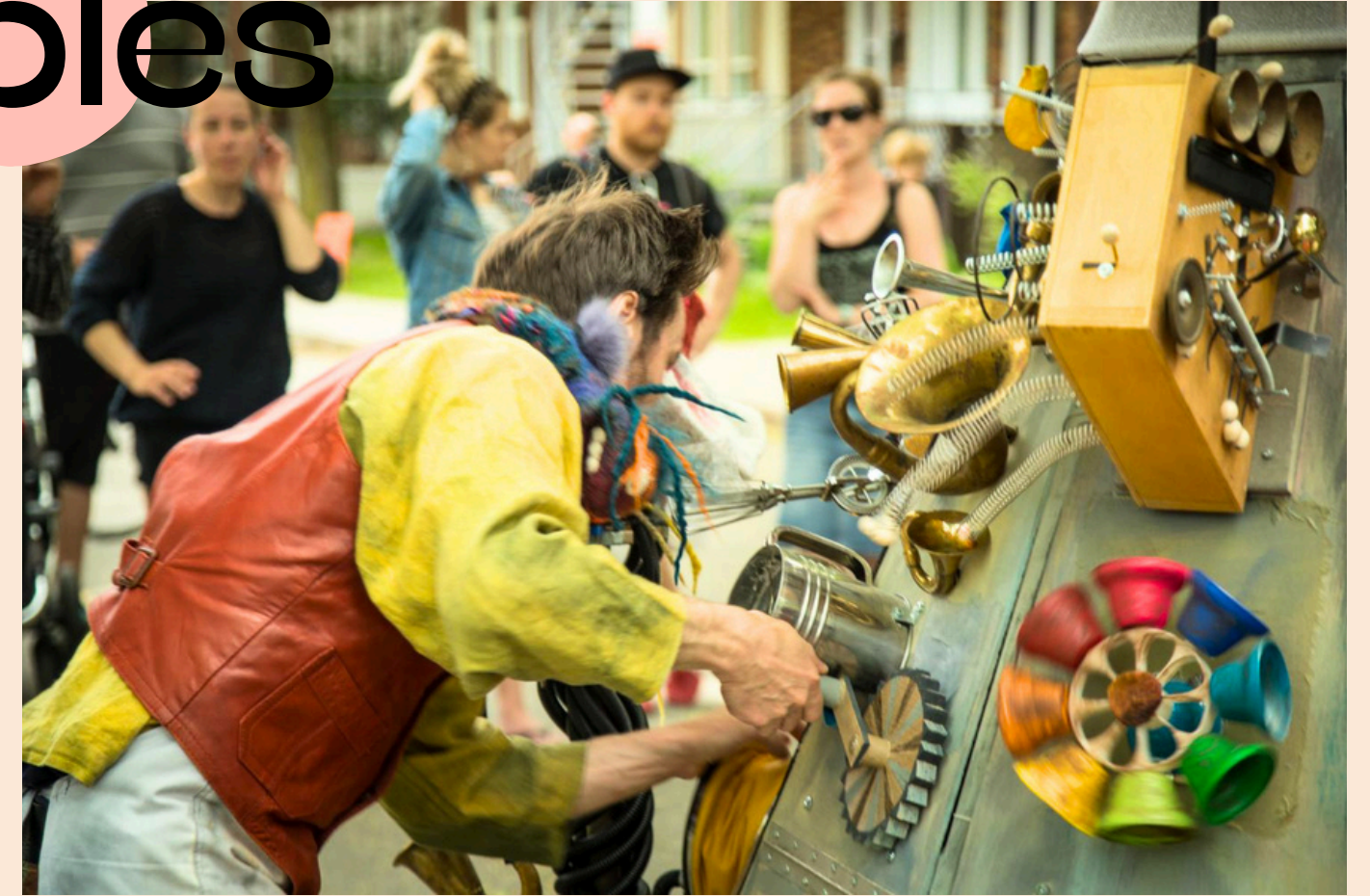
Muche truc Théâtre à Tempo