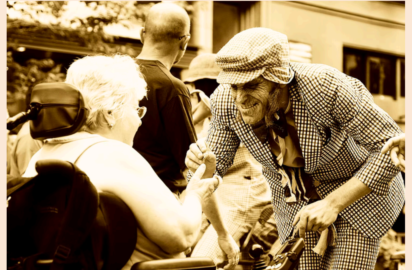
Le Troisième Cycle NomadUrbains